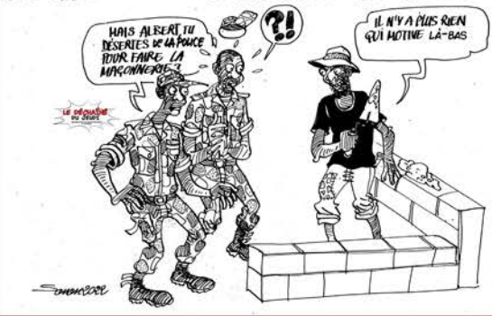
LA MAISON DE LA POLICE SE VIDE