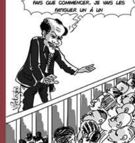
N'APPLAUDISSEZ PAS ENCORE, JE NE FAIS QUE COMMENCER, JE VAIS LES FATIGUER UN À UN