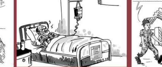
FIN DE MISSION POUR VLAYONOU