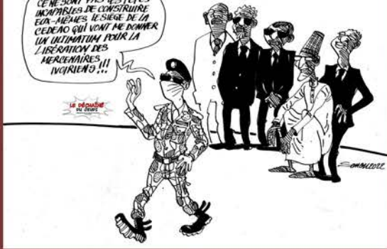
MALI : SEUL CONTRE TOUS.