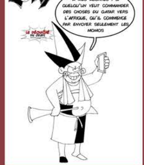
À MES ABONNÉS : SI QUELQU'UN VEUT COMMANDER DES CHOSES DU QATAR VERS L'AFRIQUE, QU'IL COMMENCE PAR ENVOYER SEULEMENT LES MONDOS