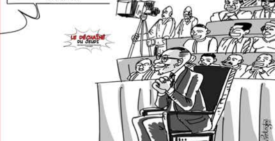
MERCI AGNONN D'ANTICIPER CE DISCOURS SUR L'ÉTAT DE LA NATION, ON POURRA UTILISER LE RESTE DU TEMPS POUR LA CAMPAGNE ÉLECTORALE.