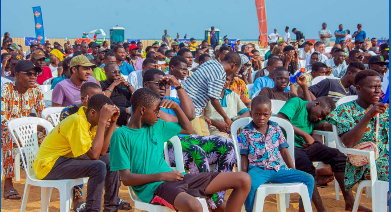
Des milliers de férus de Football venus de divers horizons.