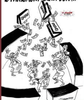
IL PLEUT DES VALISES QATAR SUR LE PARLEMENT EUROPEEN !!!