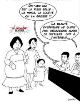
QLP66 : JAMINTAA CHERCHE PALABRES AUX FÉMINISTES