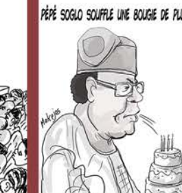
PÈPE SOGLO SOUFFLE UNE BOUGE DE PLUS