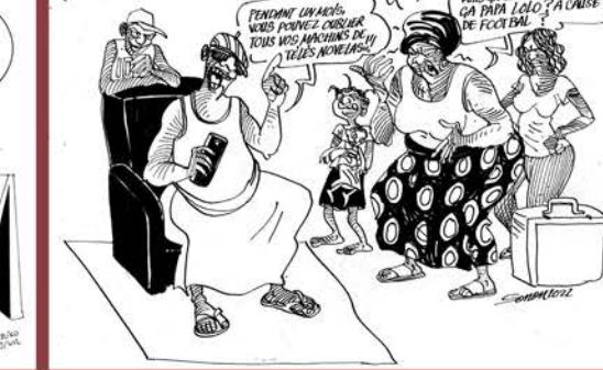
QUAND QATAR 2022 DIVISE LES FAMILLES