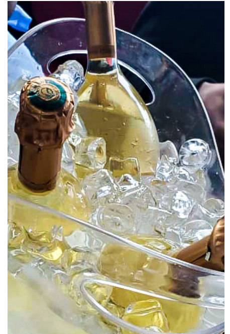
Pluie de RUIPART.