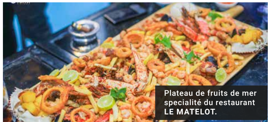
Plateau de fruits de mer specialité du restaurant LE MATELOT.