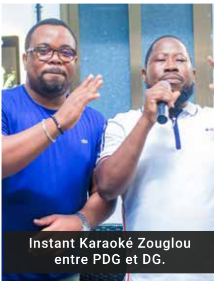
Instant Karoké Zougloou entre PDG et DG.