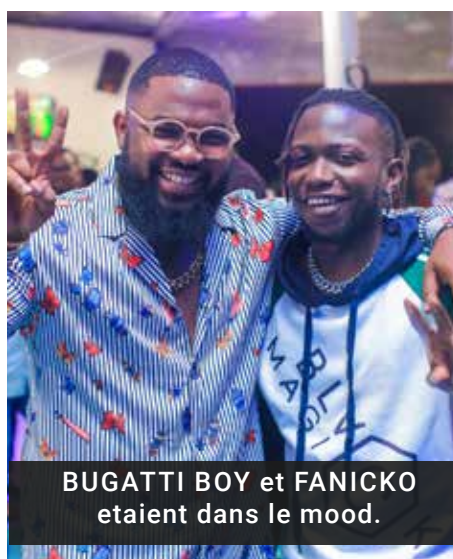
BUGATTI BOY et FANICKO etaient dans le mood.