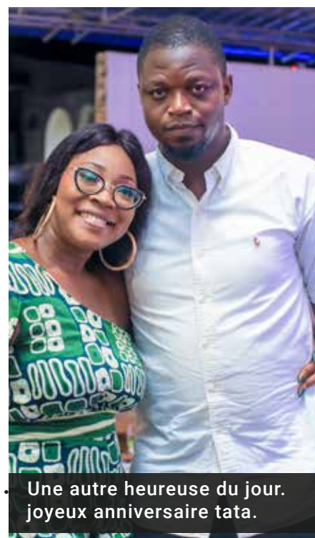
Une autre heureuse du jour. joyeux anniversaire tata.