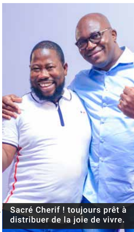
Sacré Cherif ! toujours prêt à distribuer de la joie de vivre.