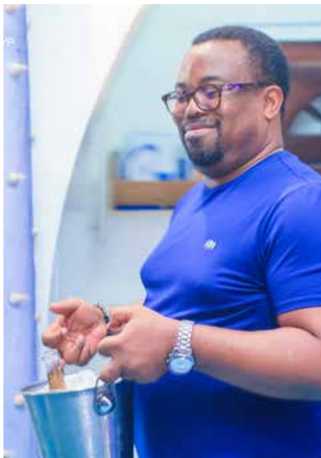
Un service 5 étoiles...Lol !