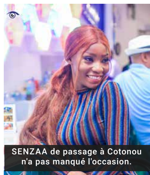
SENZAA de passage à Cotonou n'a pas manqué l'occasion.