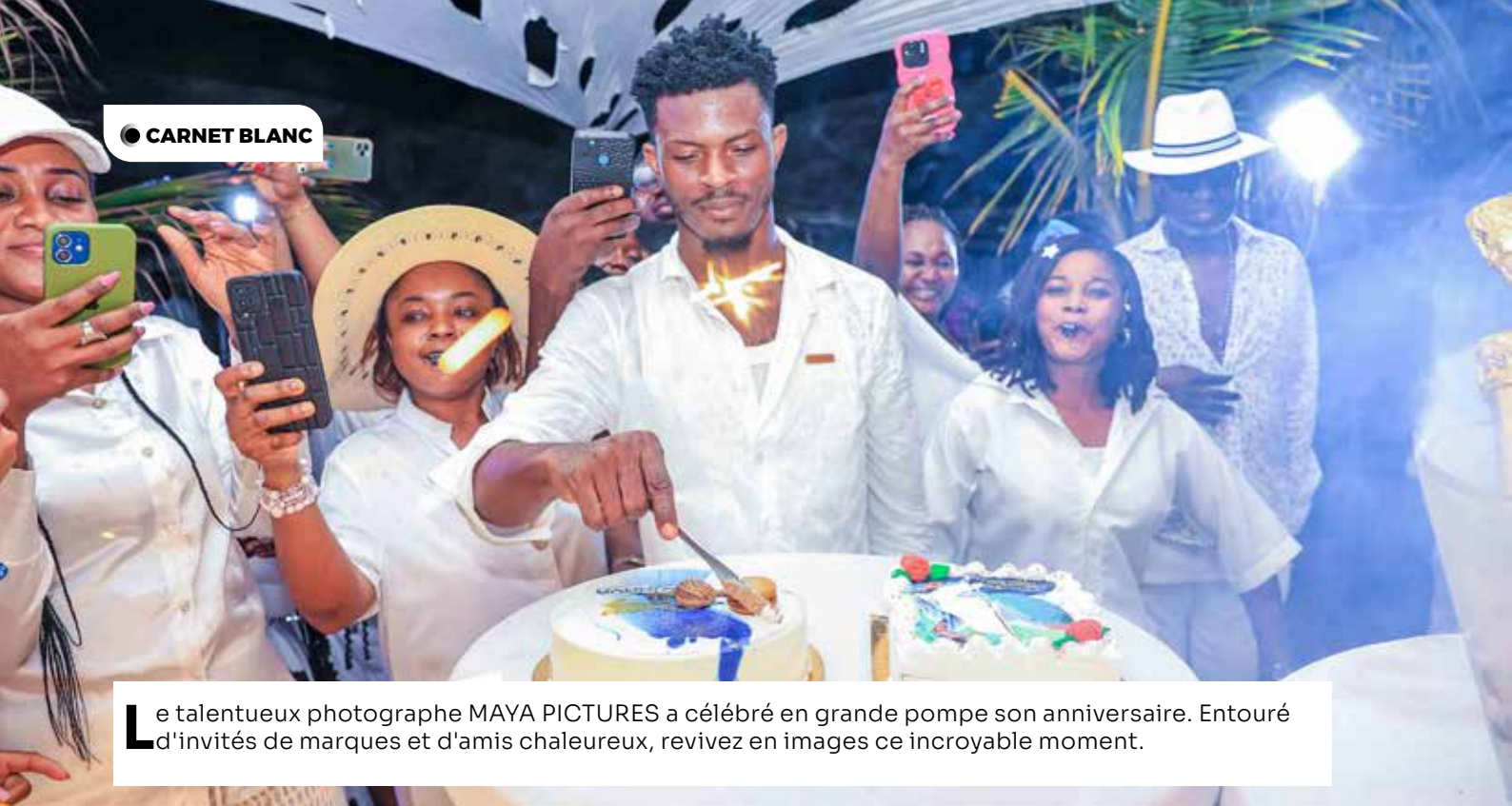
Le talentueux photographe MAYA PICTURES a célébré en grande pompe son anniversaire. Entouré d'invités de marques et d'amis chaleureux, revivez en images ce incroyable moment.